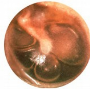
Some Fluid (air-fluid levels)