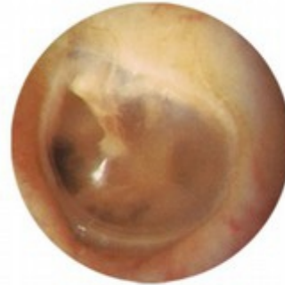
Normal Ear (no fluid)