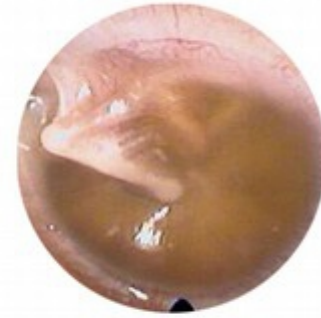
Effusion (full of fluid)